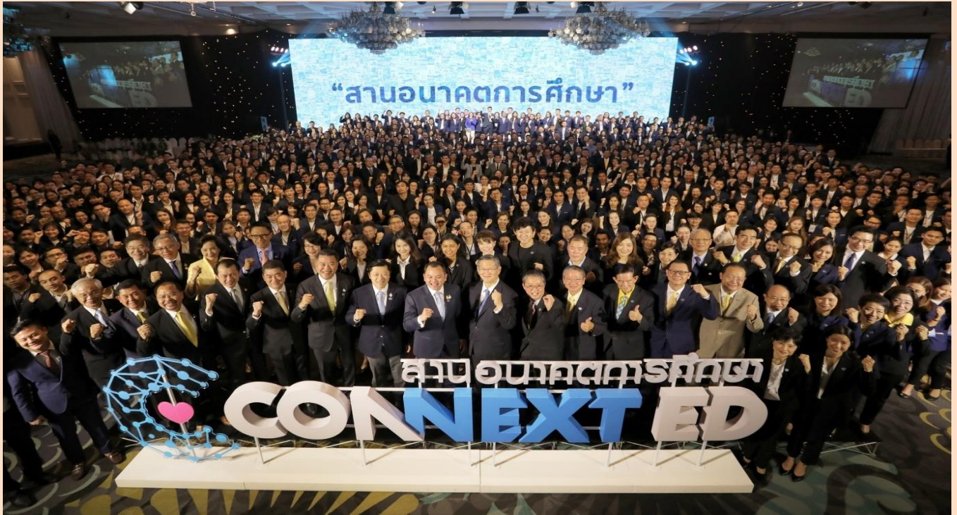
กลุ่มมิตรผลและเครือข่ายพันธมิตรที่ร่วมขับเคลื่อนโครงการสานอนาคตการศึกษา CONNEXT ED

โครงการสานอนาคตการศึกษาได้ริเริ่มมาตั้งแต่ปี 2559 โดยกลุ่มมิตรผลร่วมกับ 11 องค์กรเอกชนชั้นนำของไทย เข้าร่วมยกระดับการศึกษาไทยสู่การสร้างเด็กดี เด็กเก่ง ของประเทศอย่างยั่งยืน โครงการสานอนาคตการศึกษา CONNEXT ED เป็นการตอบโจทย์ยุทธศาสตร์การลดความเหลื่อมล้ำ พัฒนาคคน และเพิ่มขีดความสามารถของประเทศ ซึ่งจากการดำเนินการระยะแรกมาตั้งแต่ปี 2559 จนถึงระยะที่ 2 ปี 2562 นี้ ได้มีการยกระดับการจัดการการศึกษาในโรงเรียนที่เข้าร่วมโครงการสานอนาคตการศึกษา CONNEXT ED ในสังกัดสำนักงานคณะกรรมการการศึกษาขั้นพื้นฐาน (สพฐ.) ทั่วประเทศได้ถึง 4,608 โรงเรียน และมีการขยายความร่วมมือจาก 12 องค์กรเอกชนชั้นนำผู้ร่วมก่อตั้งโครงการ กับเครือข่ายพันธมิตรใหม่อีก 21 องค์กรเอกชน รวมเป็น 33 องค์กร